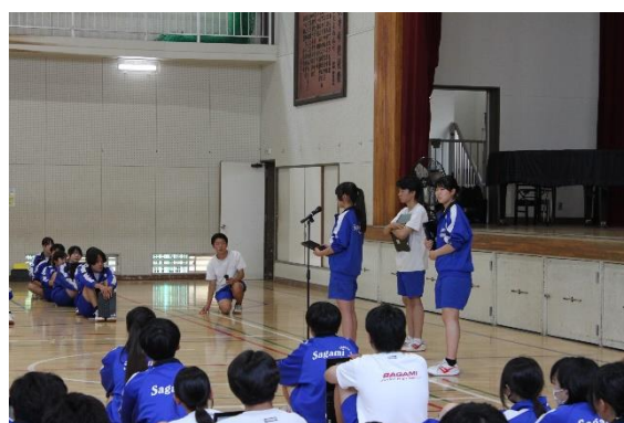
「修学旅行の取り組みと抱負」 実行委員長から

私は今回の修学旅行を一人ひとりが楽しんでほしいと考えています。だからこそ、改めて気を引き締めてもらいたいと考えています。